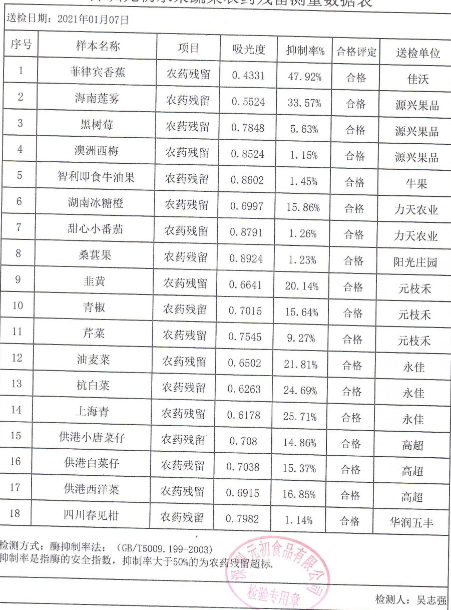
深圳元初水果蔬菜农药残留测量数据表